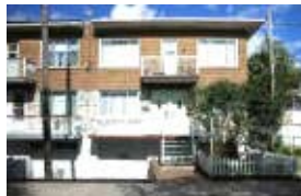
ST-MICHEL - Duplex semi-destacado c/3 qtos, cave e garagem Bom preço