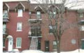
CENTRO-ESTE - Bom triplex Rendimento. Só $189.500