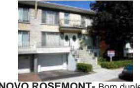
NOVO ROSEMONT - Bom duplex Ocup. dupla. Junho.Preço reduzido