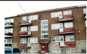
ST-MICHEL 8 plex bem situado. Grandes apartamentos $329.000