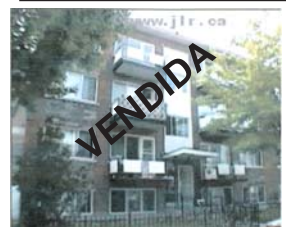
ST-MICHEL 8x4½ renovados,bom sítio Rendimento $36.300. Preço : $339.000 neg.

VILLERAY Duplex 2x5½ + "Bachelor". Esquina de rua, terraço e garagem. Impecável.