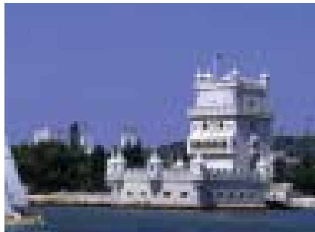
Lisboa - Torre de Belém

Arquitecto: Damon Lavelle Custo Total (estimado): 118.713.901* euros