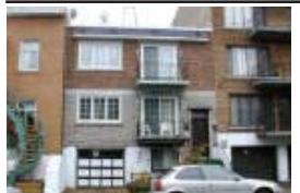
PLATEAU - Bom duplex, garagem e cave. Uma raridade. Bom preço