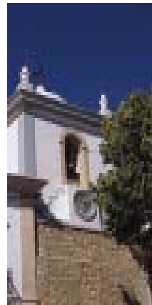
Loulé - Camara Municipal

Com vestígios concretos de ocupação romana, de que o centro de pesca e salga de peixe do Cerro da Vila em Vilamoura são o melhor exemplo, Loulé apresenta ainda facetas da sua existência da Idade Média, de que o Castelo é um ex-libris, cujas torres ainda se identificam no meio do casario, assim como alguns panos de muralha. Sendo uma cidade do interior, o desenvolvimento económico veio da aposta nos produtos agrícolas, sobretudo dos frutos secos (amêndoas e figos) e das produções artesanais, que se mantiveram durante séculos.