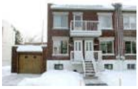
VILLERAY -Bom duplex,cave terminada. 2 garagens. Um luxo.