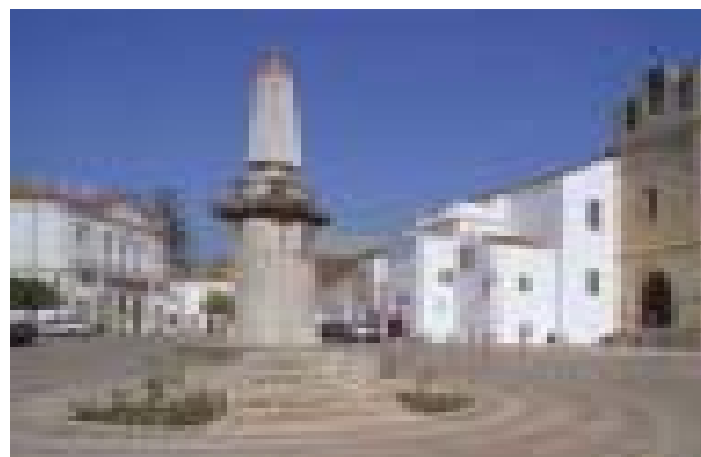
Faro - Largo da Sé Velha.