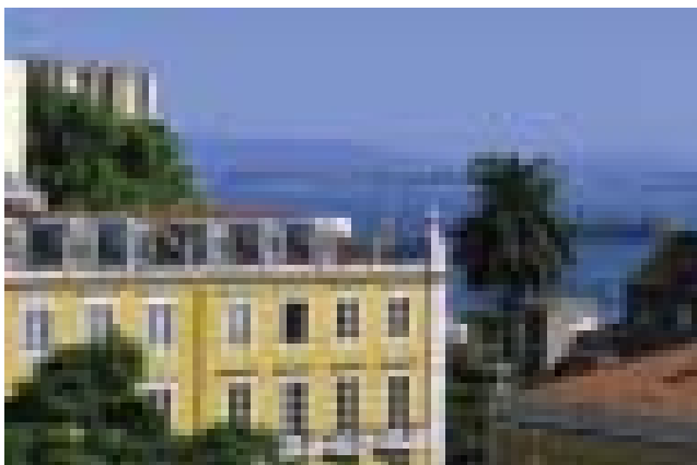
Lisboa - Castelo

Para além das suas singulares características arquitectónicas e geográficas, e do vasto património cultural, em que se destaca o Fado, Lisboa dispõe de infra-estruturas turísticas únicas, garantindo opções de entretenimento para todas as horas do dia, desde praias, desportos náuticos, golfe, restauração, discotecas e programas culturais, para além dos atractivos das lindíssimas vilas de Sintra, Cascais e Sintra.