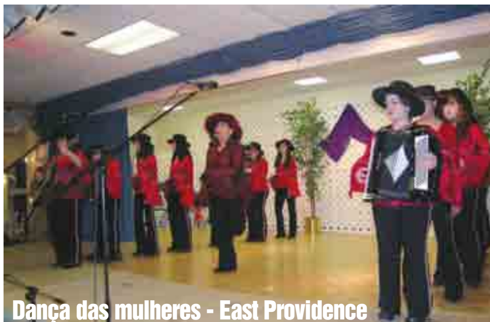
Dança das mulheres - East Providence