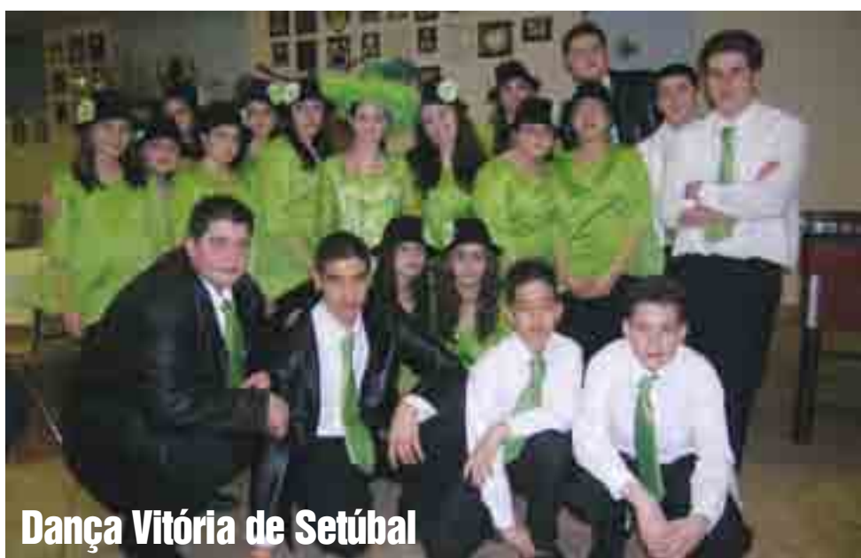
Dança Vitória de Setúbal