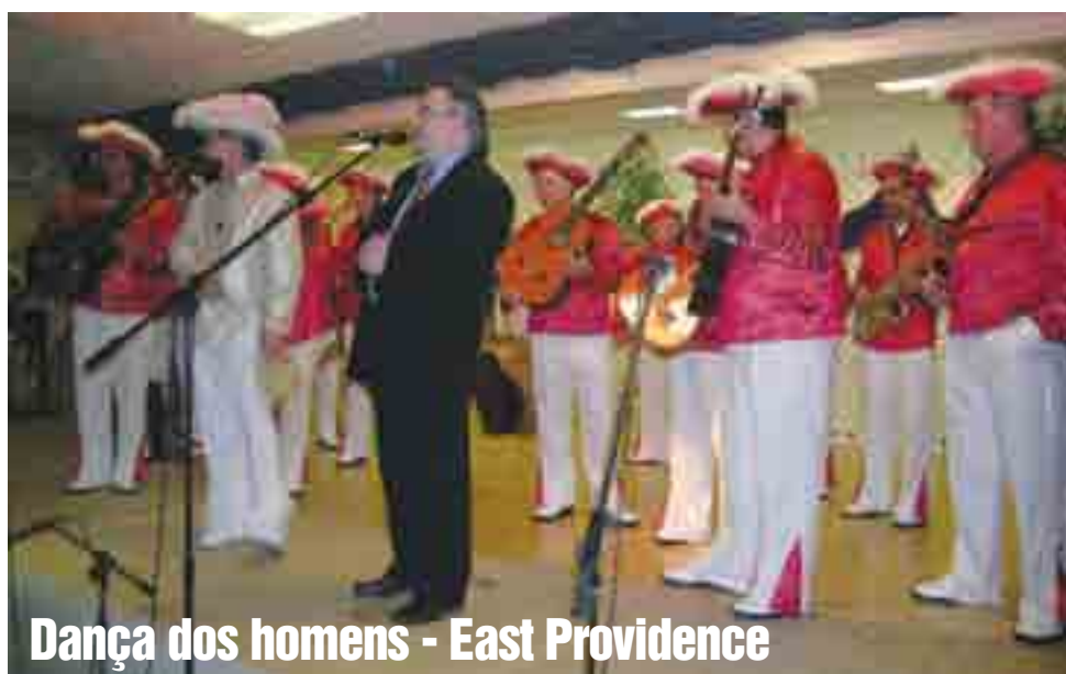
Dança dos homens - East Providence