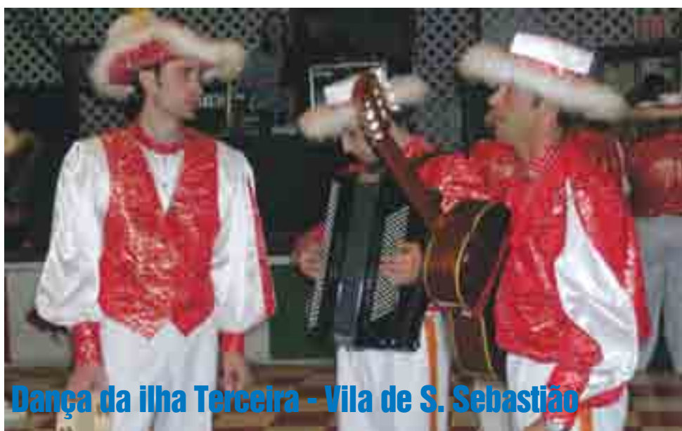
Dança da ilha Terceira - Vila de S. Sebastião