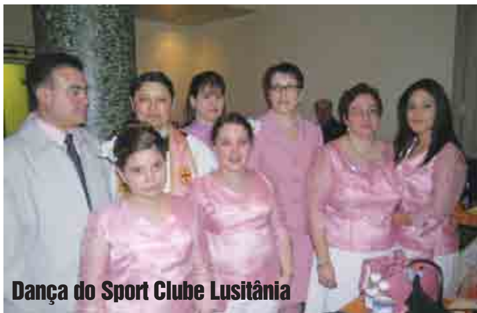
Dança do Sport Clube Lusitânia