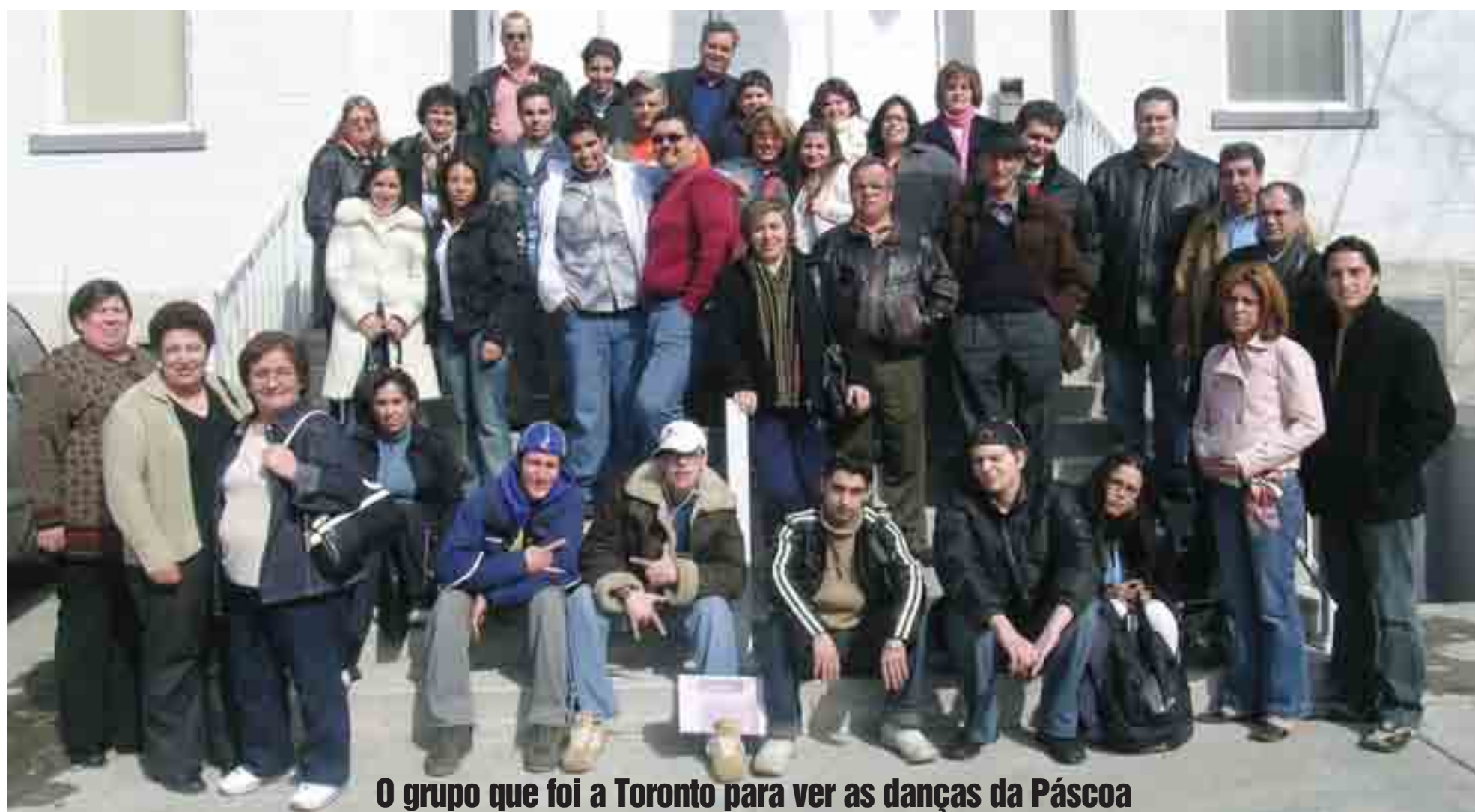
O grupo que foi a Toronto para ver as danças da Páscoa

Toronto e amigos meus Que o grande amor de Deus Esteja em seu coração Que vivem bem este dia Com paz e muita alegria Próprio da ressurreição Boas festas meus senhores Para quem é dos Açores da Madeira e Continente sem nenhuma distinção Os nossos desejos são Em geral para toda a gente