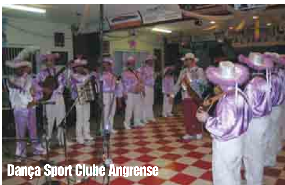
Dança Sport Clube Angrense