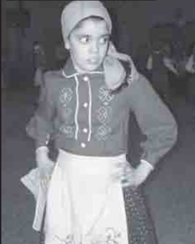
Uma aluna da escola francesa e portuguesa, uma das dançarinas dos Campinos do Ribatejo, e é uma joia desconhecida na nossa comunidade.