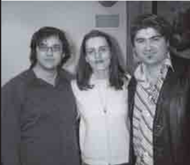
Festejando três aniversários para três amigos na comunidade.