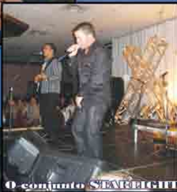
O conjunto SEARLIGHT

Este grande evento será abrilhantado por vários artistas de Portugal, Toronto e da nossa comunidade