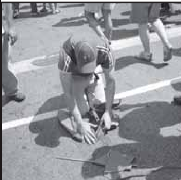
Tristeza na comunidade