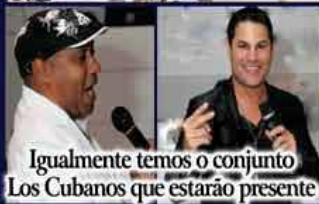
Igualmente temos o conjunto Los Cubanos que estarão presente