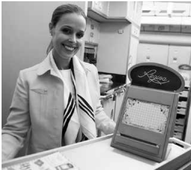
Comissária de bordo com máquina de furos de chocolate Regina

A bordo do RetroJet também viajou um “tripu-