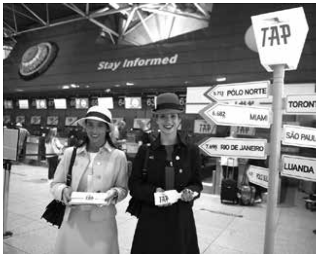
Área de check-in também foi caracterizada com imagens retro da TAP

A tripulação recebeu os passageiros vestidos com um dos uniformes mais emblemáticos da companhia, que foi desenhado pelo estilista francês Louis Féraud. Cabine de passageiros, encostos de cabeça, as refeições e até mesmo o entretenimento de bordo foi feito destinado a levar os passageiros a uma viagem no tempo.