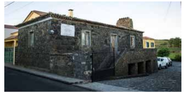
Casa na Rua da Carreira, Arrifes.

A freguesia de Arrifes possuía ainda uma variante desta tipologia que aproveitava o desnível do terreno. Apresentava-se de dois pisos e com balcão ou escada exterior. No piso inferior podia variar entre meia loja debaixo dos quartos, onde apenas existia uma porta; de loja inteira que se prolongava por toda a edificação, traduzindo-se no aparecimento de duas portas a ladear a escadaria; sem porta e com algumas aberturas no balcão; ou no sistema de porta-porta-janela. A loja situava-se no piso inferior da habitação, destinada a funções de armazenamento de géneros ou de apoio à actividade rural, incluindo a guarda de utensílios e zona de estábulo para os animais. A fachada apresentava