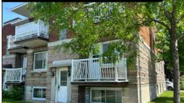
NOVO NO MERCADO 5 PLEX BOM INVESTIMENTO