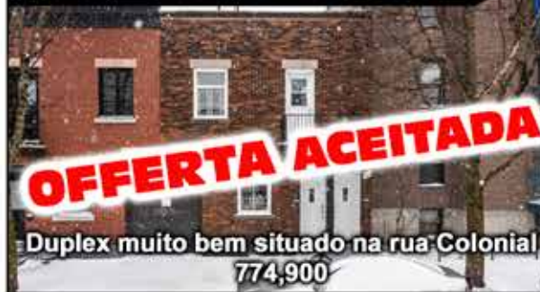
OFFERTA ACEITADA Duplex muito bem situado na rua Colonial 774,900