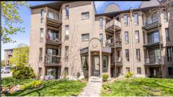
Descubra o seu condomínio dos sonhos em Pointe aux Trembles! Esta joia encantadora de 2 quartos oferece a conveniência de estacionamento ao ar livre e vem a um preço imbativelmente razoável. Não perca esta combinação perfeita de conforto, conveniência e acessibilidade! Venda sem garantia legal de qualidade, por conta e risco do comprador. 299 000$