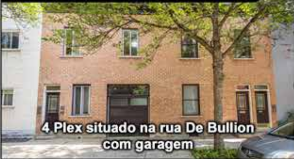
4 Plex situado na rua De Bullion com garagem