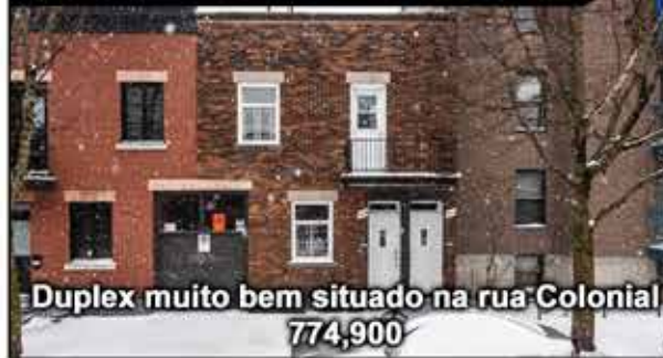
Duplex muito bem situado na rua Colonial 774,900