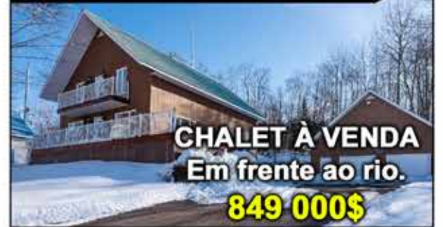
CHALET À VENDA Em frente ao rio. 849 000$