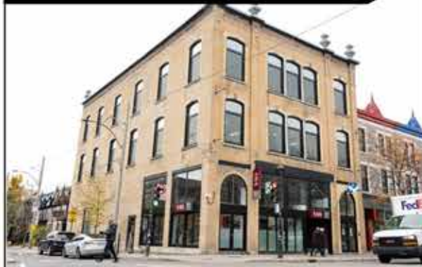
Escritórios compartilhados muito bem situado no Plateau Mont-Royal. Podem alugar por um período de 3 meses ou anualmente. 380$ por mês