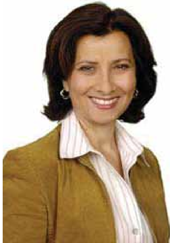
Isabel dos Santos