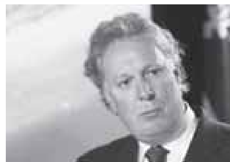
Parti Libéral du Québec Jean Charest

Os novos partidos políticos que são Quebec solidário (QS) e o Partido verde (PV) têm o mérito de propor uma nova visão da socie-