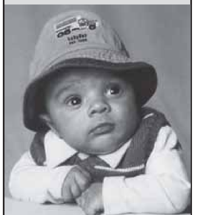
Nasceu: 18 de Outubro de 2006 Mãe: Stacey Pires Furtado Pai: Mynor Osmar Estrada