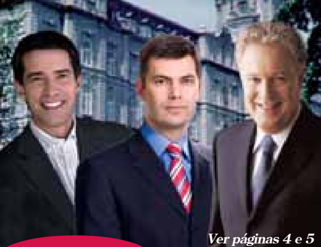
Ver páginas 4 e 5