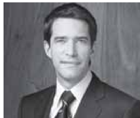
Parti Québécois André Boisclair

Finalmente, a plataforma do Partido Verde “Somos todos verdes” concentra-se maioritariamente no ambiente. As propostas são numerosas e tornam a difícil determinação das prioridades deste partido. Nem independentista nem federalista, o PV coloca contudo ao primeiro plano do seu programa a reforma das instituições democráticas, de entre as quais o modo de voto.