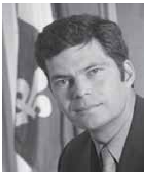
Action Démocratique du Québec Mario Dumont